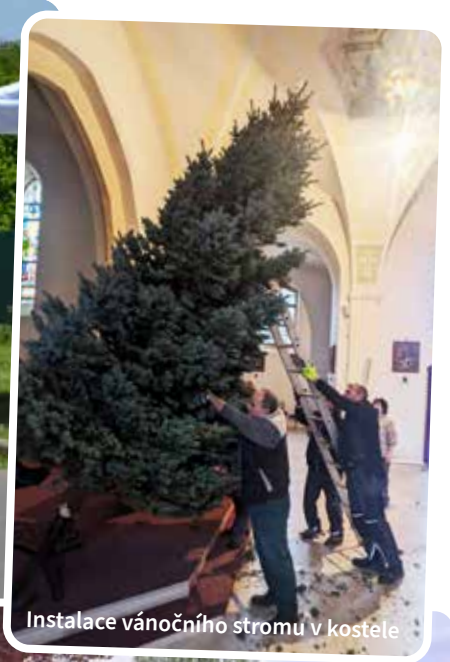
Instalace vánočního stromu v kostele