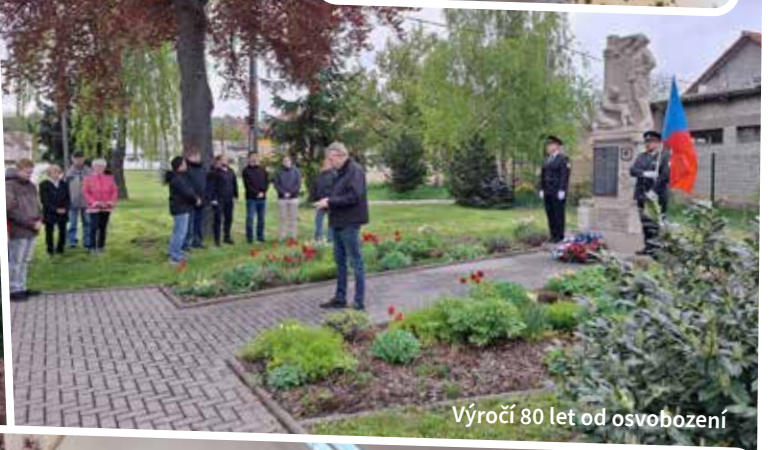
Výročí 80 let od osvobození