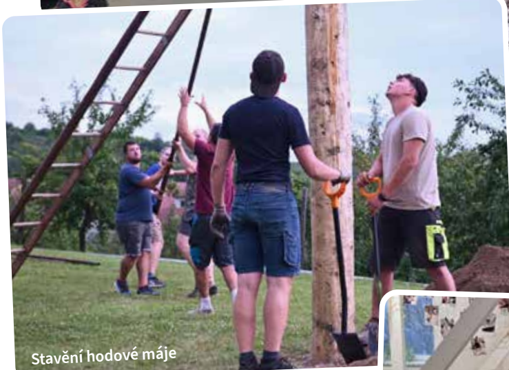
Stavění hodové máje