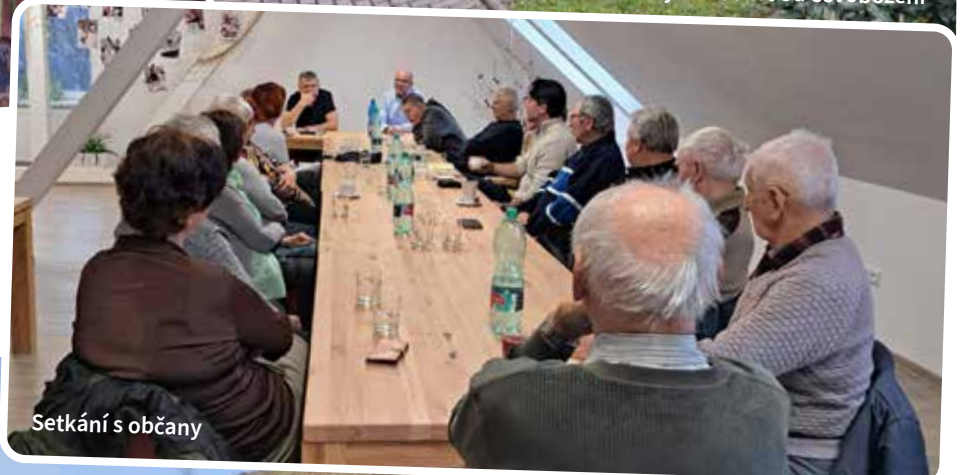
Setkání s občany