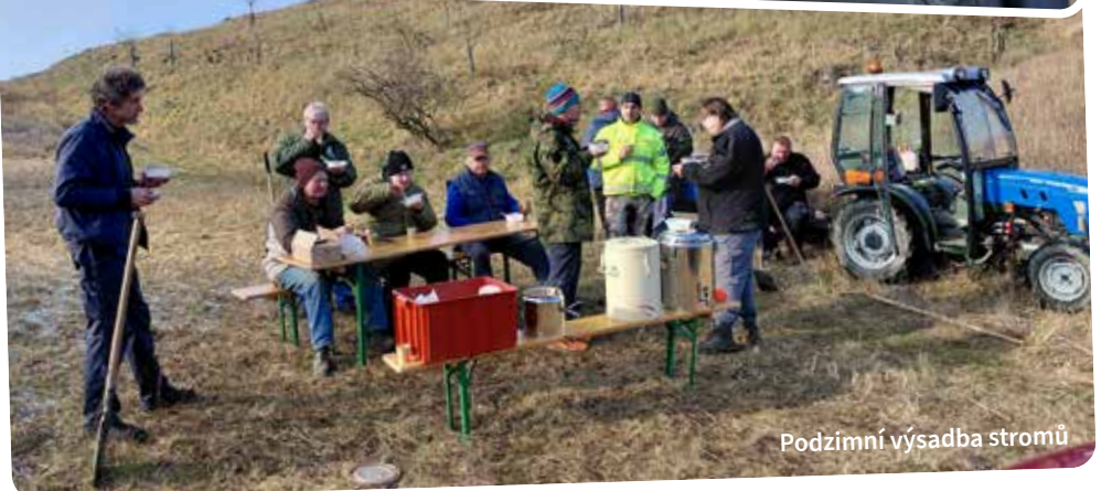
Podzimní výsadba stromů